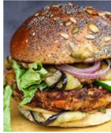
INDISCHE VEGGIE BURGER