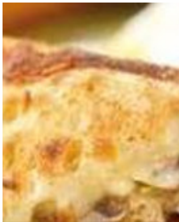
TOSTI MET BRIE EN CHAMPIGNON