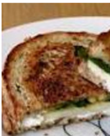
CROQUE MET GEITENKAAS