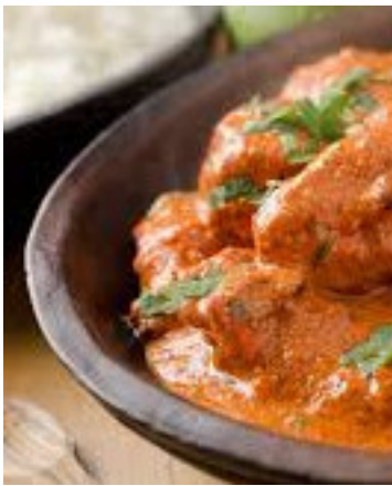
INDISCHE TIKKA MASALA